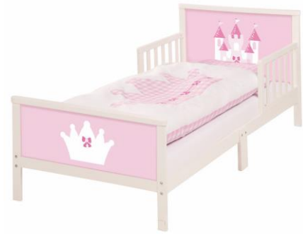
Różowe łóżeczko dziecięce Roba Castle, 70 x 140 cm