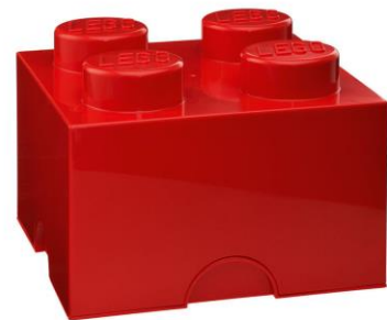
Czerwony pojemnik kwadratowy LEGO®

Odpowiednio zaaranżowany pokój może pomieścić wszystko, czego potrzebuje nasz maluch. Warto pomyśleć o miejscu do przechowywania, który ułatwi dziecku utrzymanie porządku. Czerwony pojemnik kwadratowy w kształcie klocka LEGO®, a może kuferek Star Wars™? Nasze dziecko chętniej pozбира do nich zabawki czy szkolne przybory. Duża kolekcja resoraków? Możemy ją wyeksponować na drewnianej półce w kształcie