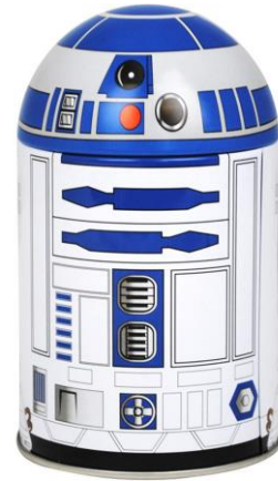
Skarbonka Star Wars™ R2D2

Odpoczynkowi naszych pociech sprzyjać będzie również pościel z wizerunkiem myszki Mickey, komplety do łóżeczek niemowlaka, nocne lampki przypominające postaci z bajek, a nawet indiański hamak. Tego typu designerskie dodatki do dziecięcego pokoju znajdziemy w ofercie klubu zakupowego Bonami.pl.